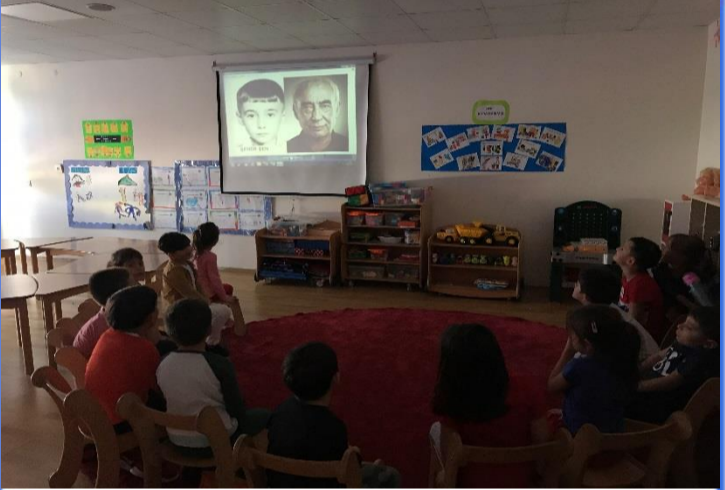
Çocuklar İçin Felsefe: Aynı kişinin farklı zamanlarda çekilen fotoğraflarına bakarak farklılıkları ve kişilik değişimlerini tartıştık.