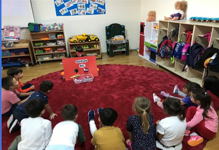
Oyun Etkinliği: Dokun bil oyunumuz ile sınıf eşyalarımızı hissetmeye çalıştık.