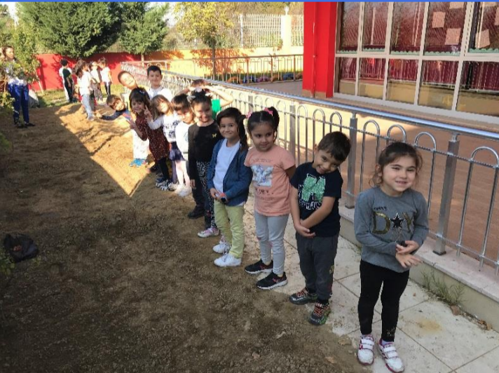
Tarım Alanı: Tarım alanımıza soğan ve havuç ektik.