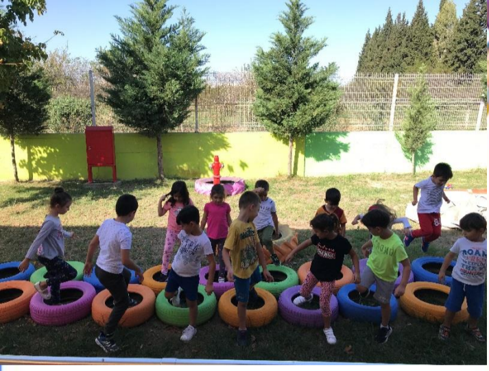
Oyun Etkinliği: Bahçemizdeki renkli tekerlekler ile içeride dışarıda oyunu oynadık.