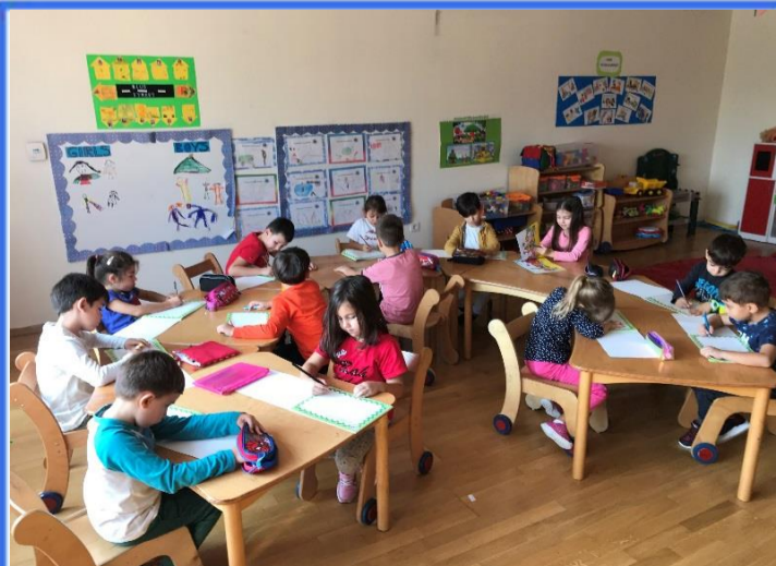
Değerler Eğitimi: Kıvrık ile Değerler Eğitimi kitabımıza başladık.