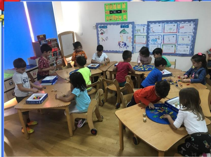
Serbest Zaman Etkinliği: Akıl oyunlarımız ile oynayarak keyifli zaman geçirdik.