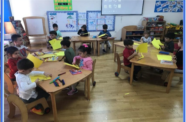
Türkçe Etkinliği: Ev adreslerimiz hakkında sohbet ettik ve evimizi oluşturduk.