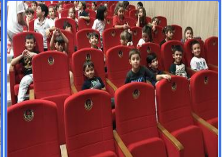
Tiyatro Oyunu : Ağaçların Dansı tiyatro oyununu ilgiyle izledik.