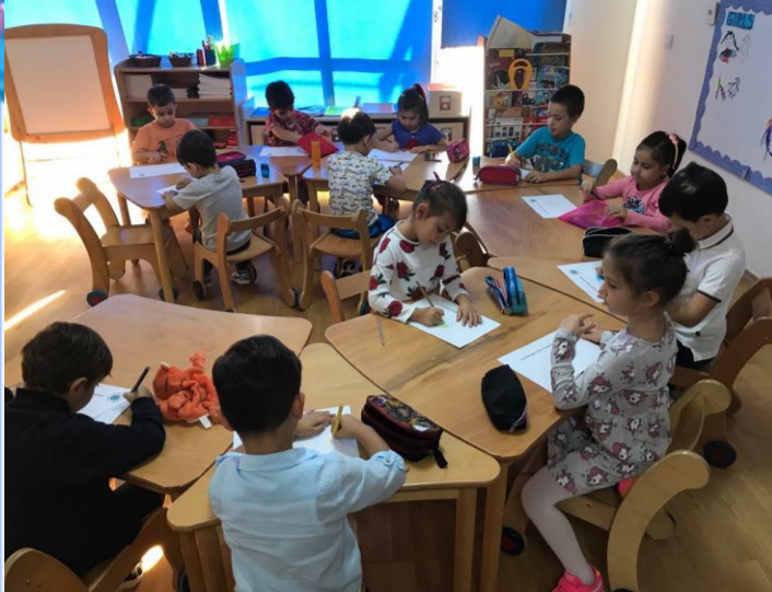
Türkçe ve Sanat Etkinliği: Hayalimizdeki Dünyayı konuştuk ve oluşturduk.