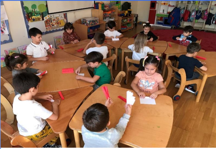
Yaşayan Atatürk Etkinliği: 'Yaşayan Atatürk' Köşemizi güncelledik.