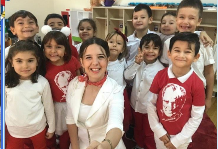
Cumhuriyet Bayramı: Cumhuriyet bayramımızı coşkuyla kutladık.