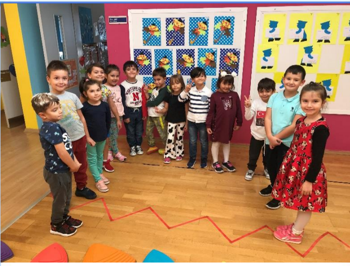
Sanat Etkinliği: Sonbahar yaprakları sanat çalışmamızı yaptık.