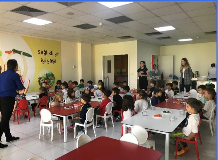
Mutfak Etkinliği: Turşu kurmayı öğrendik ve turşularımızı özenle hazırladık.