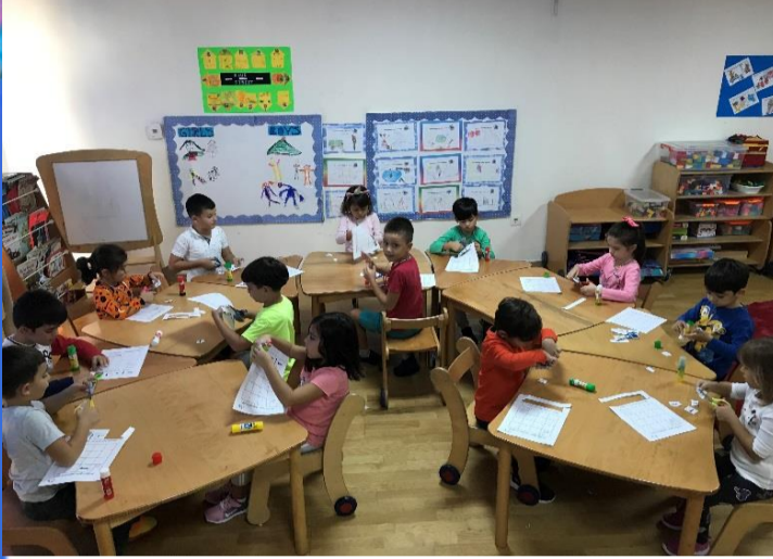
Matematik Etkinliği: Yön kavramını öğrendik. Oklar ile yön çalışmamızı yaptık.