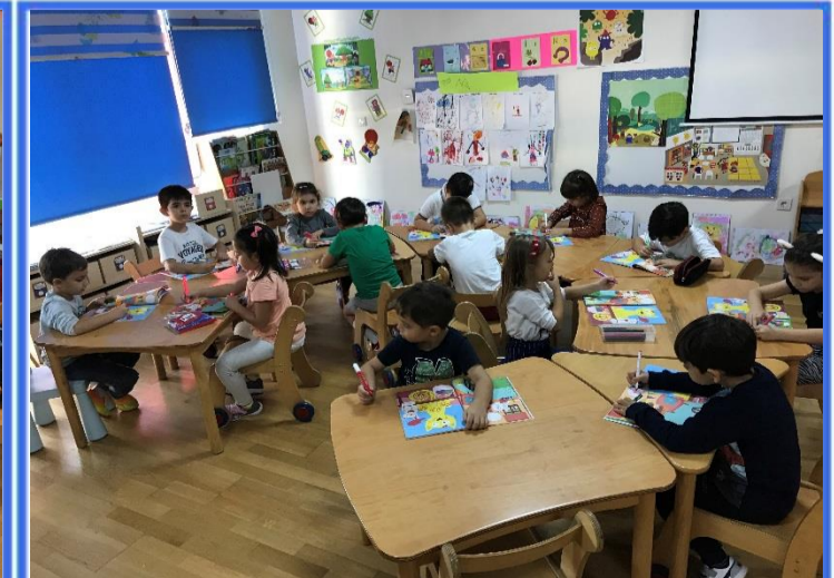
Kitap Çalışması: Gizemli Çizgiler Ormanı maceramız devam ediyor.