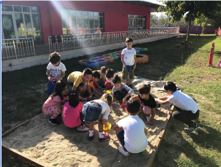
Bahçe Etkinliği: Kum havuzda doyasıya oynadık.