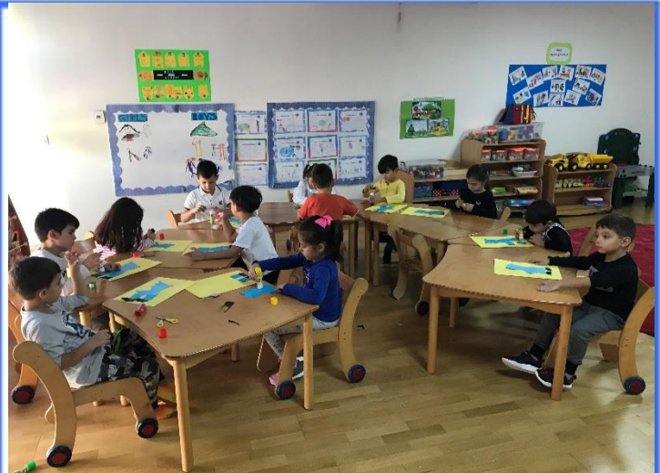
Türkçe Etkinliği: Postacı mesleğini tanıdık. Hayalimizdeki mesleği postacımıza teslim ettik.