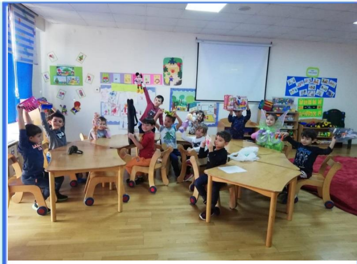
Rehberlik Dersimiz : Rehber öğretmenimiz ile, Göster-Anlat etkinliklerimize başladık.