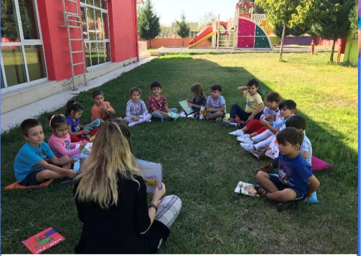
Kitap Günü Saati: Bahçemizde kitap okuma saatimizi gerçekleştirdik.