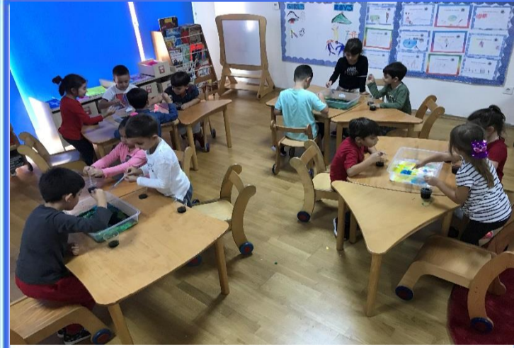
Eğlenceli Bilim: Eğlenceli Bilim dersimiz de hava kabarcıklarını ve kabaran gökkuşuğunu öğrendik.