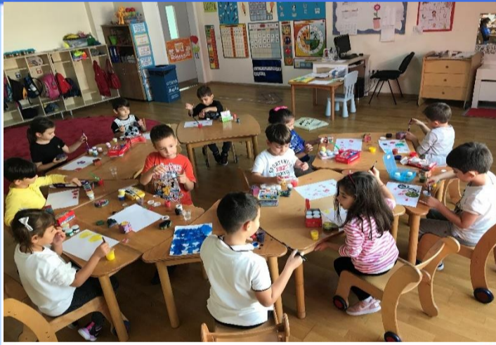
Matematik Etkinliği: Kareyi öğrendik ve kare baskı çalışması yaptık.